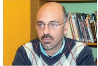
| Secretario General